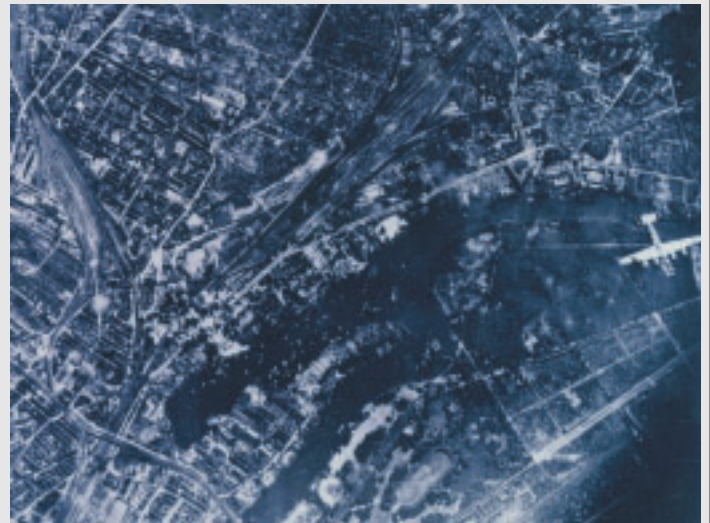
Foto eines Bombenabwurfs über Berlin, Rummelsburger Bucht.

Die tatsächliche aus Kampfmitteln resultierende Gefahr gelangt kaum noch an die Öffentlichkeit. Hieran sind die Branche sowie die verschiedenen staatlichen Stellen nicht unschuldig. Wurde in der Vergangenheit die Gefährdung doch nicht deutlich genug herausgestellt. Das hat nunmehr eine Unkenntnis breiter Bevölkerungsschichten und auch